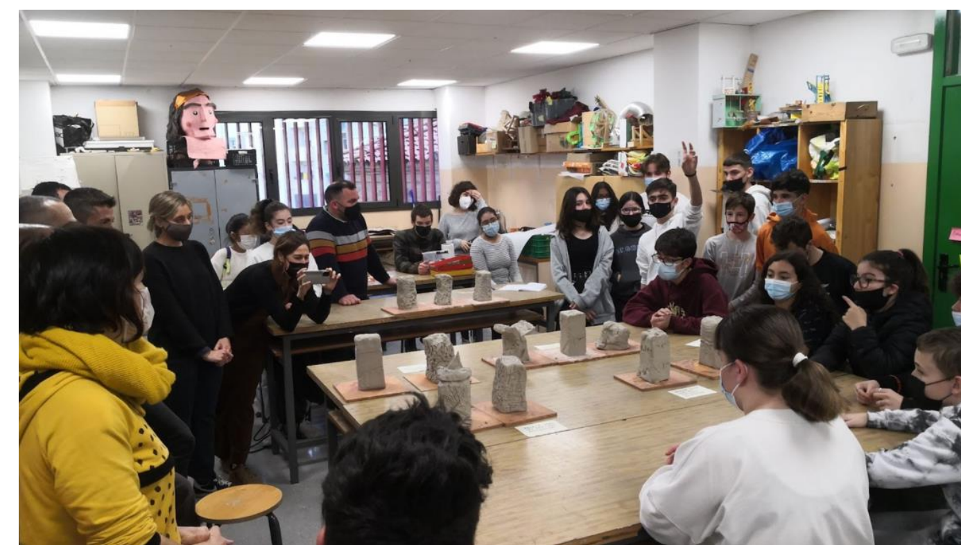
Formació en justícia global, art sostenible, participació i artivisme