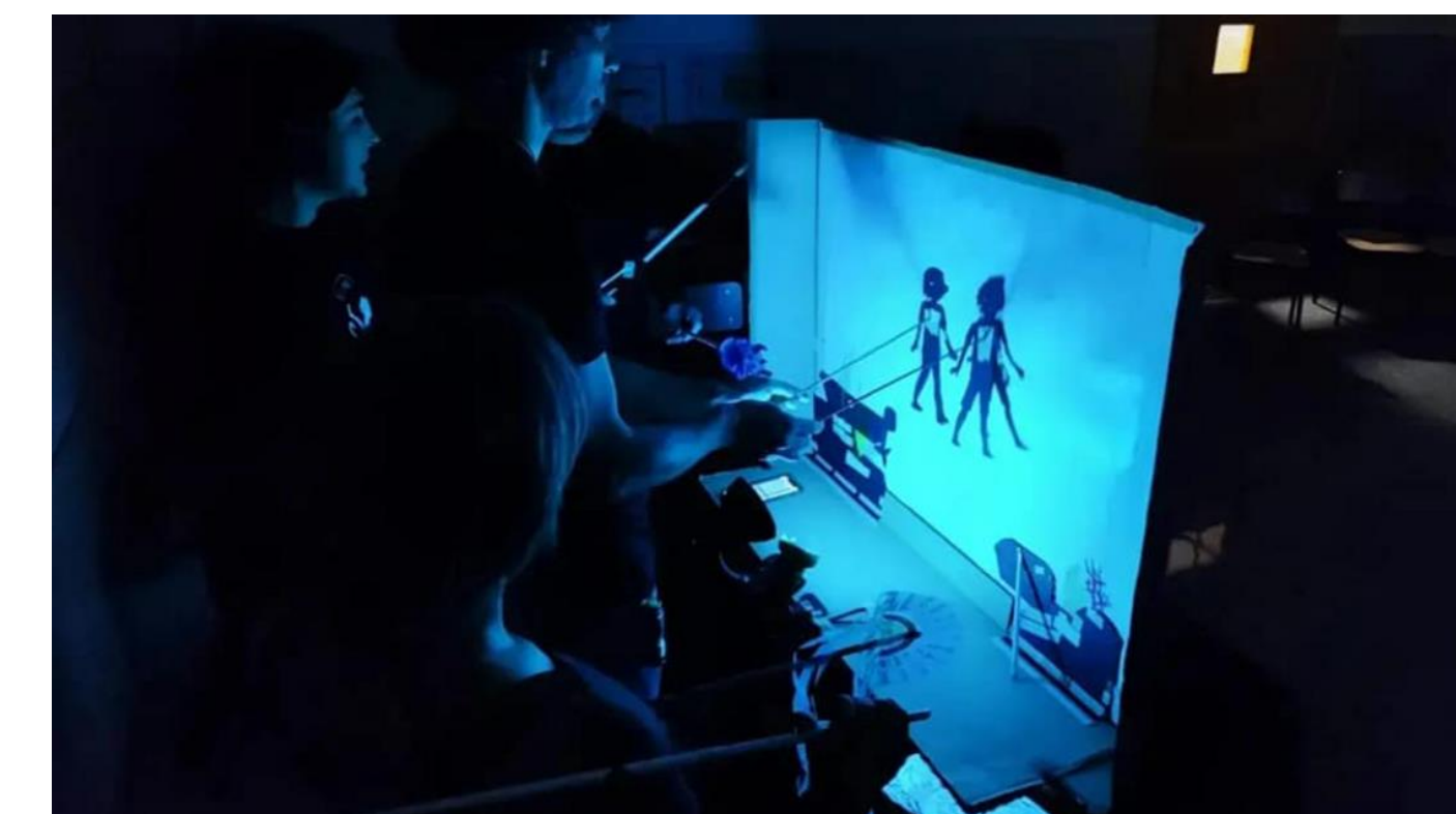
Espectacle simultani a 18 centres escolars