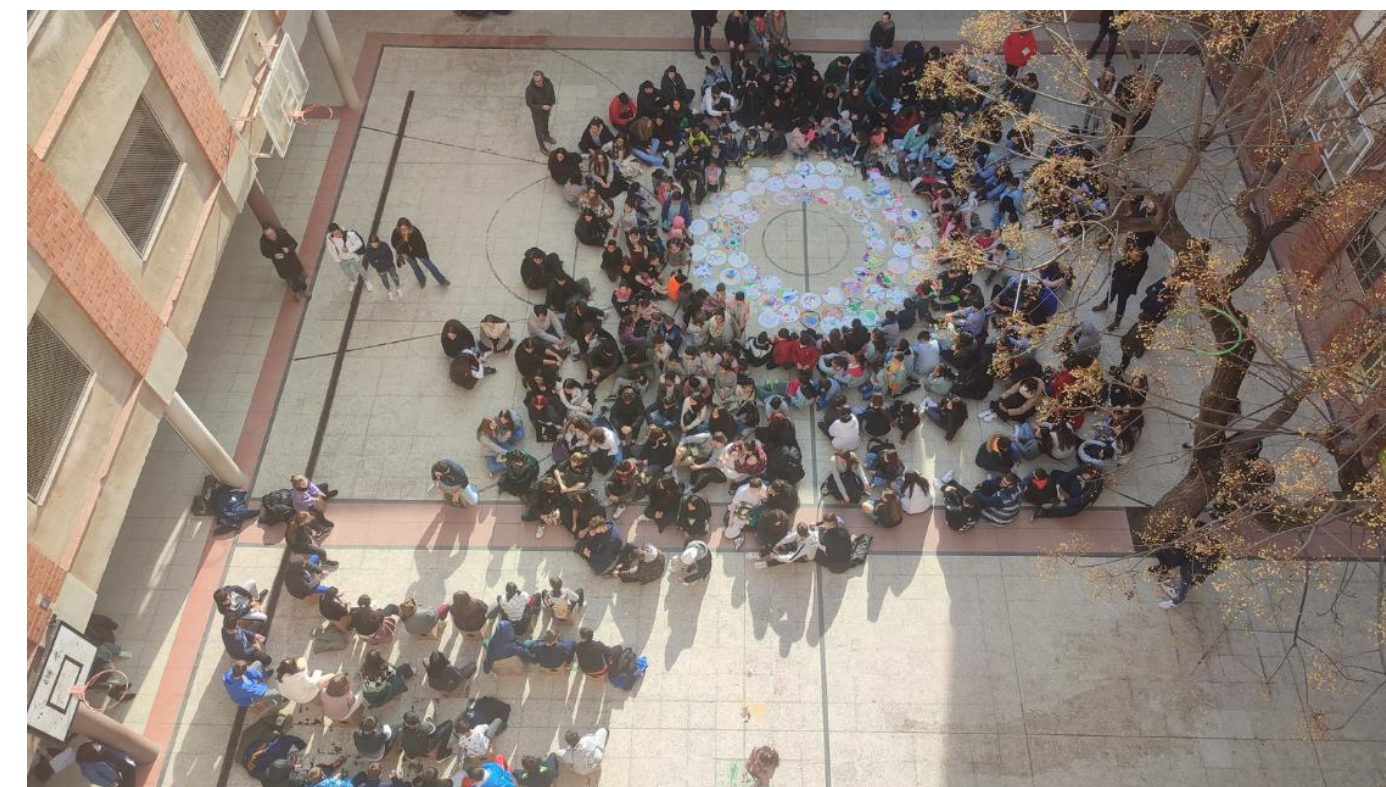
Tallers de dinamització i sensibilització